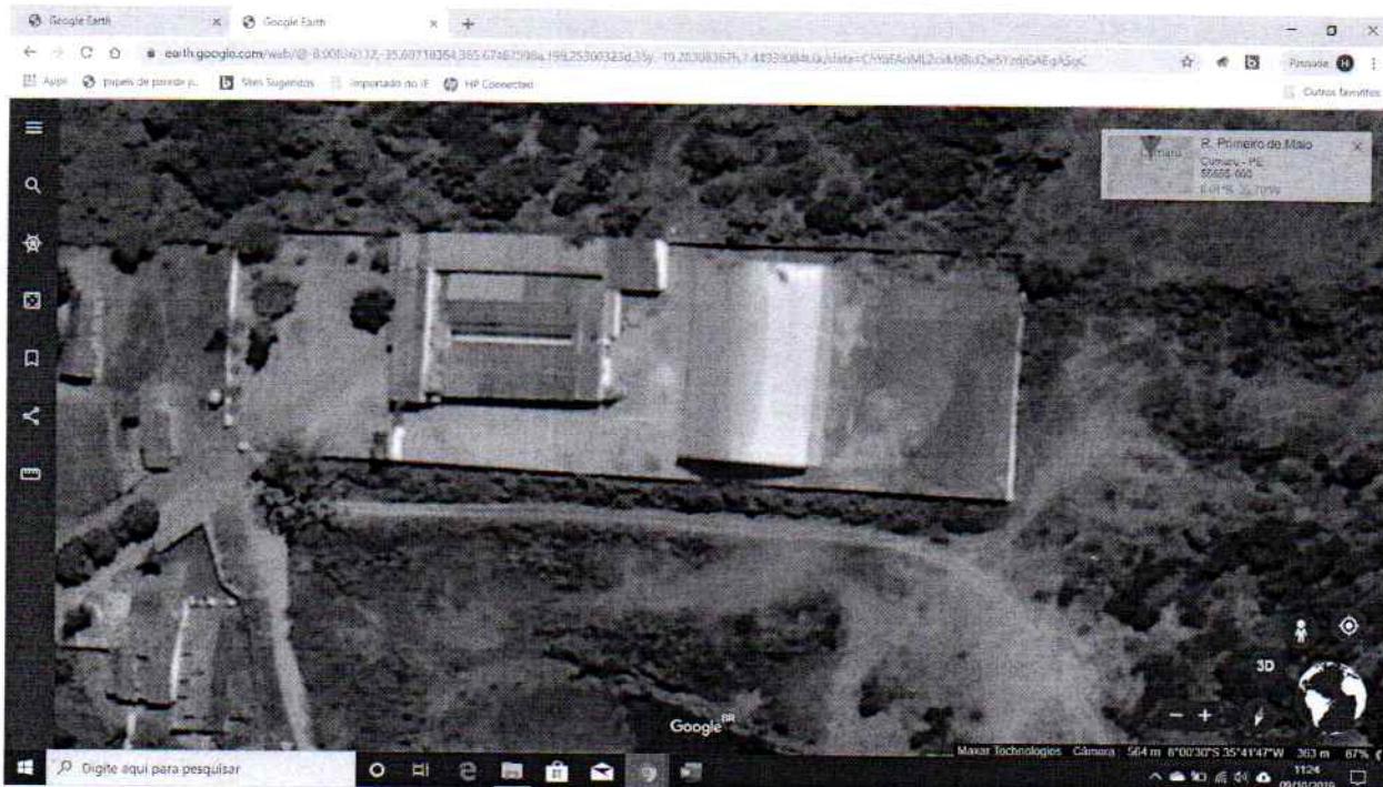
Imagem 1 - Vista Aérea da Quadra

Edificação: Quadra Poliesportiva Coberta Endereço: Rua 1º de Maio CEP: 55.655-000